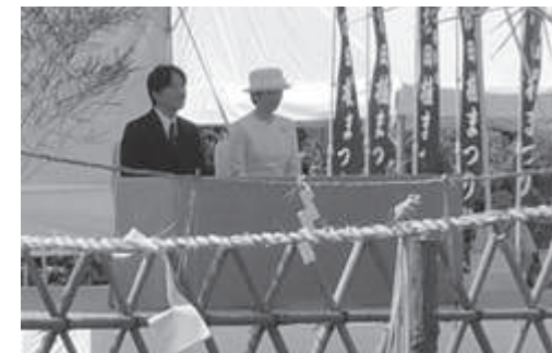
主基斎田100周年記念式典に参加（四国新聞）

跡地には、記念石碑が建立されたり公園にされたり、日本酒がつくられ、大嘗祭斎田選定を記念して「お田植祭り」などと称して全国各地で、大嘗祭が語り継がれているのです。そして、秋篠宮夫妻は「主基斎田100周年記念式典」に、しっかりと出席しているのです。