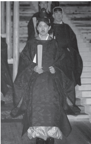
1900年「大嘗宮の儀」に参列 (AbemaTIMES)

占いで選定された田んぼでの田植え・稲刈りは、しめ縄を張り巡らせた竹矢来の田で、儀式の度ごとに神職のお祓いを受け、完全に